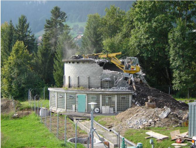
Abbruch des in Zukunft überflüssigen Rundbaus