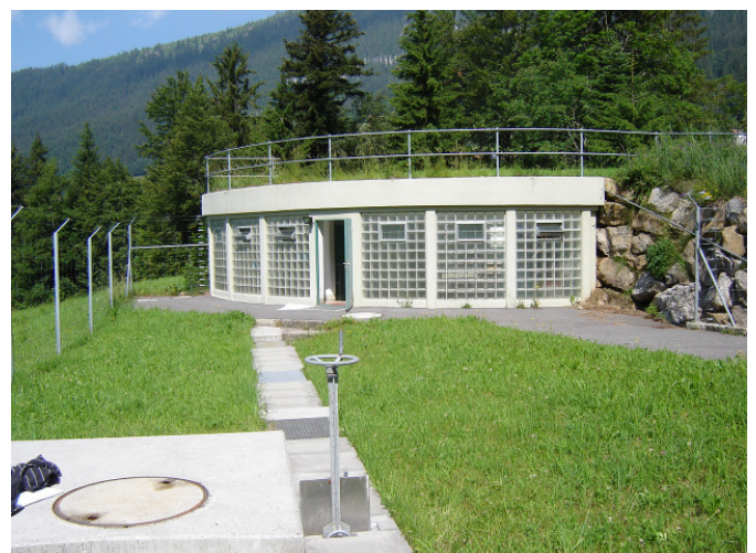
Nach dem Umbau